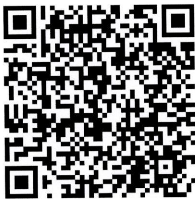
注册报名缴费二维码